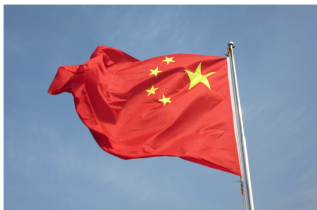
CHINESE FLAG

problemów związanych z dziedzictwem wojen na Bałkanach w latach 90. Nic więc dziwnego, że zderzają się tam interesy wielu podmiotów zagranicznych.