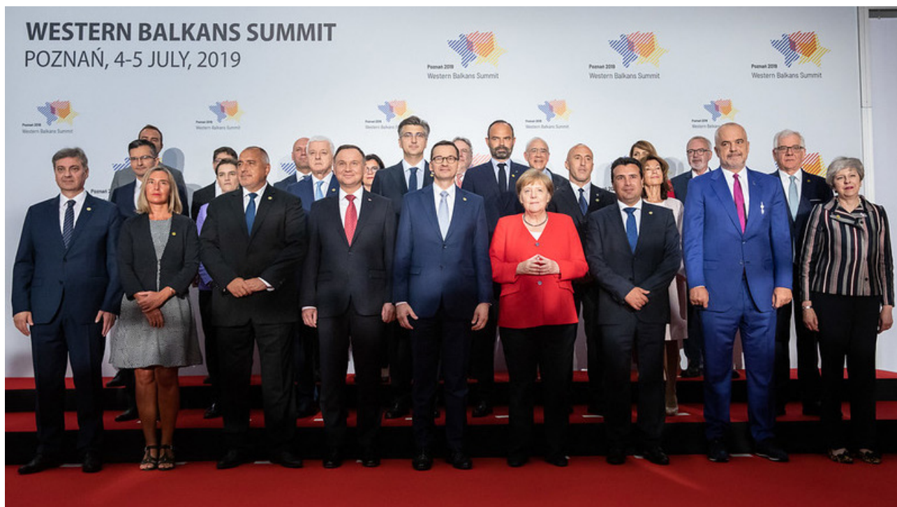
WESTERN BALKANS SUMMIT 2019, 05.07.2019, POZNAŃ

obywatelskiego. Inicjatywa ma jednak w swoim założeniu stanowić dopełnienie procesu integracji europejskiej, a nie być dla niego alternatywą. Istotą Procesu Berlińskiego jest jednak utrzymanie Bałkanów Zachodnich w orbicie wpływów Unii Europejskiej. Biorąc pod uwagę zainteresowanie innych aktorów międzynarodowych tym regionem,