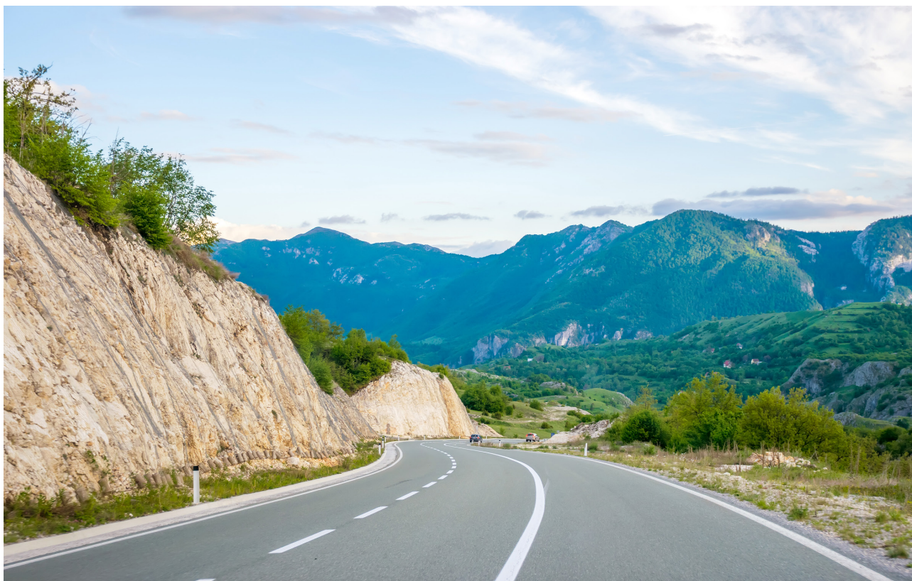
ROAD OF MONTENEGRO AMONG ROCKS AND TUNNELS

w budowie infrastruktury drogowej, morskiej i lotniczej są jednym z głównych wyzwań integracji regionu Bałkanów Zachodnich. Równie ważne pozostaje wybranie najlepszej drogi rozwoju oraz zbilansowanie wydatków na infrastrukturę, innowacje czy też rozwój energetyki. Hiszpania korzystając ze środków UE rozbudowała swoją sieć infrastrukturalną, przekraczając potrzeby transportowe stąd powstawały tak nierentowne inwestycje jak lotniska, które nie obsługiwały pasażerów, czy połączenia autostradowe, które nie są często użytkowane. Wydaje się jednak, że w przypadku Bałkanów Zachodnich, głównym zagrożeniem w tym zakresie pozostaje przesadne uzależnienie się od pożyczek z Chin, które w ten sposób realizują swoje własne interesy gospodarcze w Europie. UE aby więc sprostać potrzebom regionu w zakresie infrastrukturalnym potrzebuje strategii dynamicznej polityki inwestycyjnej na Bałkanach Zachodnich.