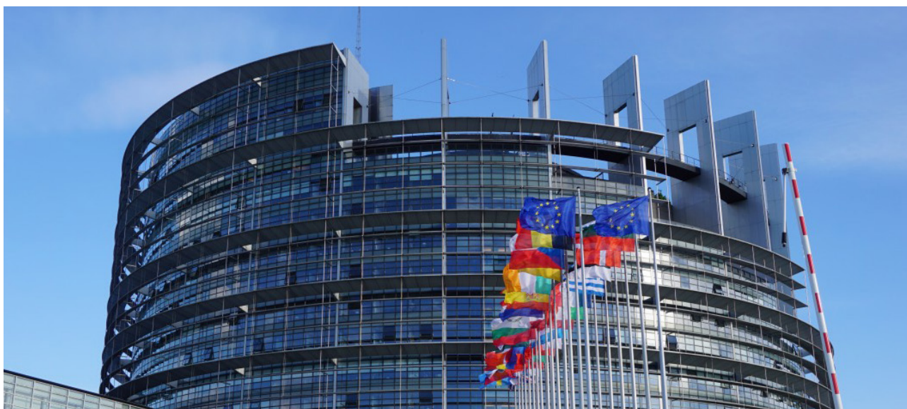
EUROPEAN PARLIAMENT IN STRASBOURG

Destabilizacja polityczna regionu Bałkanów Zachodnich może stanowić dla Unii Europejskiej dużo większe wyzwanie niż inne zagrożenia w bliskim sąsiedztwie wspólnoty. Bałkany Zachodnie są „miękkim podbrzuszem” Unii Europejskiej. Ewentualne konflikty w regionie mogą skutkować nagłym napływem migrantów z regionu Bałkanów Zachodnich do państw UE. Szczególnym zagrożeniem dla Unii Europejskiej w utracie wpływów na Bałkanach Zachodnich jest możliwość zwiększenia wpływów Chin, Rosji czy Turcji w regionie. Zasady włączania Bałkanów Zachodnich w orbity polityczne i gospodarcze tych państw będą odmienne od tych oferowanych przez Unię Europejską. Chiny i Turcja próbują poszerzać swoje wpływy w oparciu o ekspansję ekonomiczną, udzielanie kredytów, wsparcie w rozwój infrastruktury czy energetyki.