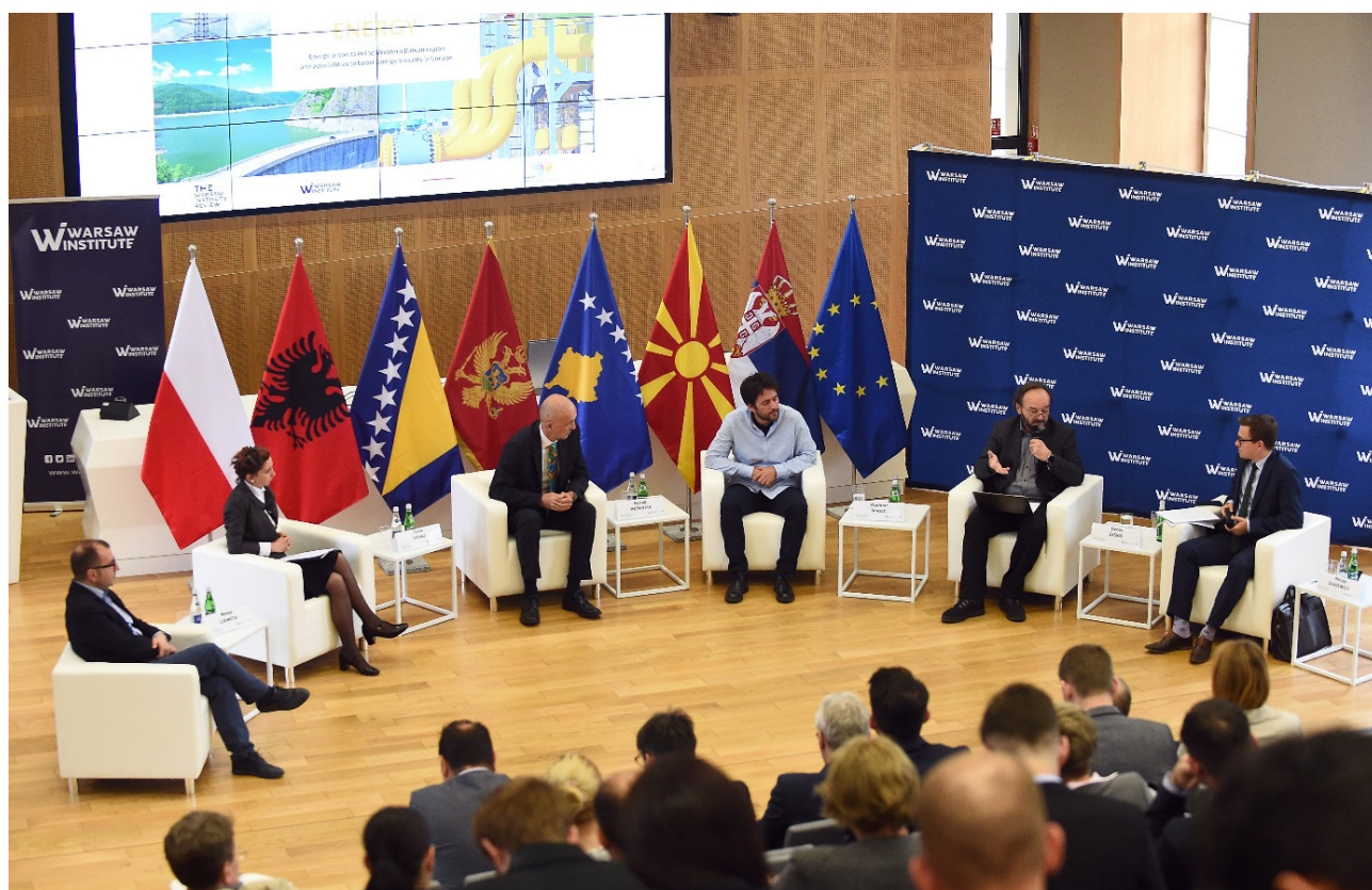
CONFERENCE „WESTERN BALKANS: INFRASTRUCTURE AND ENERGY FROM A GEOPOLITICAL PERSPECTIVE”. 29.05.2019, WARSAW

w przeprowadzaniu reform wymiaru sprawiedliwości, spotkały się z rozczarowaniem francuskich elit politycznych. Sprzeciw Francji wobec integracji europejskiej Bałkanów Zachodnich może więc wynikać z obawy, że w obecnym procesie negocjacyjnym państwa tego regionu nie zostaną odpowiednio zweryfikowane pod kątem praworządności. Stąd apel prezydenta Emmanuela Macrona o wprowadzenie odpowiednich mechanizmów kontrolnych do procesu negocjacji akcesyjnych. W wymiarze geopolitycznym Francja natomiast może obawiać się, że po akcesji państw Bałkanów Zachodnich zwiększy się znaczenie polityczne Niemiec, które to pozostają głównym partnerem handlowym dla państw regionu.