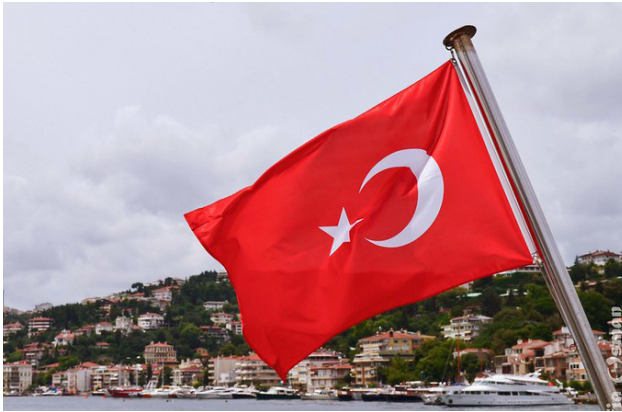
TURKISH FLAG

Turcja natomiast najprawdopodobniej będzie prowadziła działania na rzecz połączeń drogowych na Bałkanach Zachodnich. Ankarą zainwestowała ok. miliard euro w budowę odcinka autostrady łączącej serbski Sandżak (region zamieszkiwany przez ludność muzułmańską) z Sarajewem. Kolejna turecka inwestycja za ok 250 mln euro została przeznaczona na 17 km odcinek autostrady, wraz z mostem