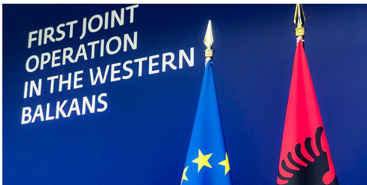
LAUNCH OF FIRST JOINT INTEGRATION IN THE WESTERN BALKANS, 21.05.2019

Kolejnym istotnym wydarzeniem dla procesu integracji europejskiej Bałkanów Zachodnich był Szczyt Rady Europejskiej w Salonikach w 2003 roku, na którym zapewniono, że wszystkie państwa biorące udział w SAP są potencjalnymi kandydatami do członkostwa w Unii Europejskiej. Perspektywa przyłączenia państw Bałkanów Zachodnich do Unii Europejskiej miała stanowić podstawową zachętę do wprowadzania demokratycznych reform w tych państwach. Jednakże proces zbliżenia z Unią Europejską był zróżnicowany w regionie. Od czasu przystąpienia Chorwacji do Unii Europejskiej w 2013 roku, nie ma ustalonych dat kolejnych rozszerzeń Unii Europejskiej.