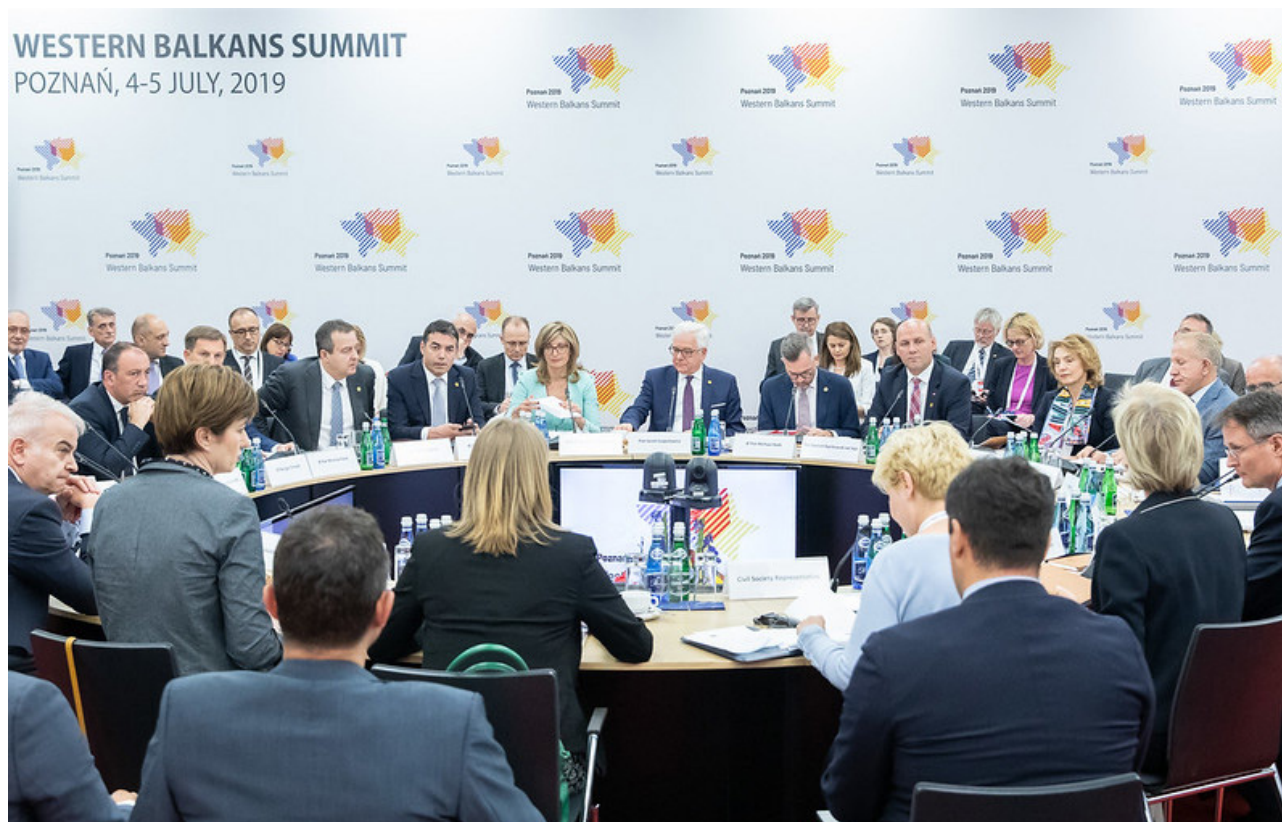
WESTERN BALKANS SUMMIT 2019, 04-05.07.2019, POZNAŃ

europejską państw Europy Centralnej. Polska nie posiadając bezpośrednich interesów gospodarczych w regionie Bałkanów Zachodnich traktuje ten region jako perspektywiczną część Europy, która po akcesji do UE będzie mogła zintegrować się z projektem „Trójmorza”, który został zaproponowany w 2015 roku przez prezydentów Chorwacji i Polski. Projekt ten zakładał integrację 12 państw UE położonych w pobliżu mórz Adriatyku, Bałtyckiego i Czarnego. W skład tej grupy wchodzi: Austria, Bułgaria, Chorwacja, Czechy, Estonia, Litwa, Łotwa, Polska, Rumunia, Słowacja, Słowenia i Węgry. Można założyć, że Polska będzie rozwijała współpracę z Bałkanami Zachodnimi przy wykorzystaniu inicjatywy „Trójmorza” jako platformy składającej się z państw okalającej ten region. Trójmorze nastawione jest na rozwój projektów infrastrukturalnych, wzmocnienie spójności Unii Europejskiej oraz ścisłą współpracę transatlantycką. Państwa Bałkanów Zachodnich aspirujące do Unii Europejskiej, (z wyjątkiem Serbii) już teraz prowadzą ożywiony dialog transatlantycki oraz zaangażowane są w projekty infrastrukturalne w regionie. Można więc przypuszczać, że inicjatywa „Trójmorza” będzie działała na rzecz interesów politycznych i gospodarczych państw Bałkanów Zachodnich.