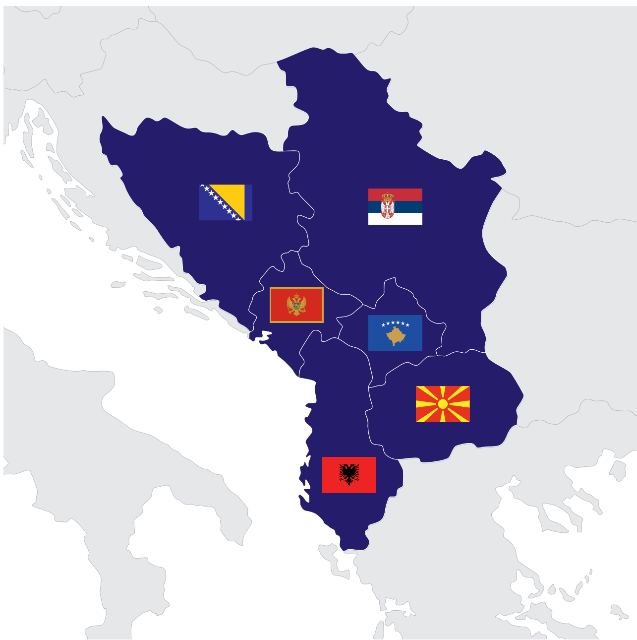
WESTERN BALKANS

Bałkany Zachodnie są ważne dla UE również z gospodarczego punktu widzenia. Znajdują się bowiem na ważnym szlaku handlowym pomiędzy Europą Północną i Południową. W interesie UE pozostaje więc budowanie silnej infrastruktury komunikacyjnej i energetycznej w regionie. Bałkany Zachodnie należy postrzegać także jako wciąż niewykorzystany w pełni rynek inwestycyjny.