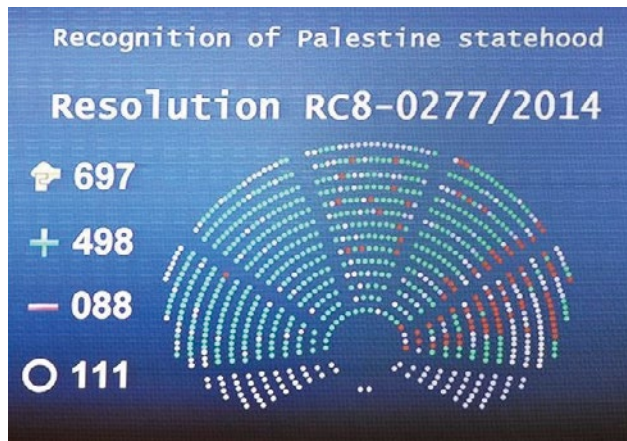
Obr. 2: Hlasování EP o uznání Palestiny

Pokud se znovu podíváme na ono hlasování, faktická převaha pro uznání Palestiny přesně potvrzuje naši výchozí teorii. I když Evropský parlament ani v jednom zdroji nezveřejnil hlasování každého jednotlivého poslance, alespoň z vizuálního pohledu je možné vidět, že z levicového spektra hlasoval proti pouze jeden poslanec. Více zastání u Izraele nalezneme u lidovců, především od českých poslanců. Například člen EPP Tomáš Zdechovský se proti rezoluci hlasitě ozval a zmínil i nádech antisemitismu ve štrasburských prostorách: