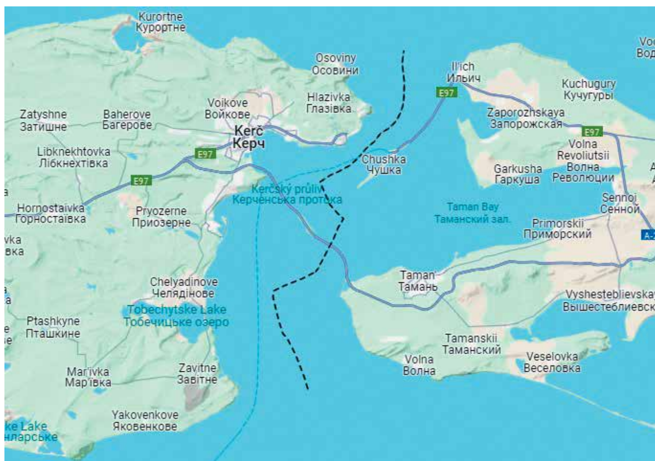
Obrázek 5: Přemostění Kerčského průlivu a napojení na Rusko.

Druhá část projektu, most pro železnici, byla dokončena a uvedena do provozu v prosinci roku 2019. Blíže ke Kerči je vyvýšená oblouková část umožňující proplouvání velkých lodí do přístavů v Azovském moři. Půl roku po začátku ruské invaze na Ukrajinu (8. října 2022) byla silniční část vážně poškozena explozí. K dalšímu poškození došlo v noci z 16. na 17. července 2023, kdy podle ruské strany most poničily námořní drony. Kvůli anexi Krymu a ukrajinské blokáde je přítom tato stavba mimořádně důležitá pro dopravní spojení poloostrova s Ruskem a jeho zásobování. V poslední době se objevily informace o jednáních rusko-čínské delegace, která by měla vyústit ve vznik konsorcia s cílem vybudovat pod mořem dopravní tunel. 8