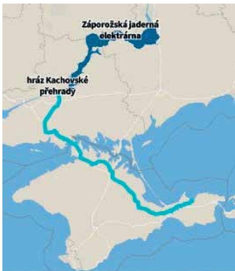
Obrázek 6: Severokrymský vodní kanál.

Chersonské oblasti a pak přes Perekopskou šíji poblíž severního pobřeží až do Kerče. V posledním úseku od vesnice Zelenyj Jar do Kerče je voda vedena vodovodním potrubím. Nejvyšší možná propustnost kanálu je 380 krychlových metrů za sekundu. Kanál každoročně přiváděl přes 1,2 miliardy krychlových metrů vody, tedy asi 85 % celkové spotřeby vody na Krymu. Stavba kanálu také umožnila zavlažovat asi 270 tisíc hektarů stepi, která se změnila na vinice, sady a pole (pěstovala se zde nejvíce rýže a obilniny). Pro rozvod vody ze Severokrymského kanálu sloužila i řada menších kanálů, mj. Krasnohvardijský nebo Azovský kanál.