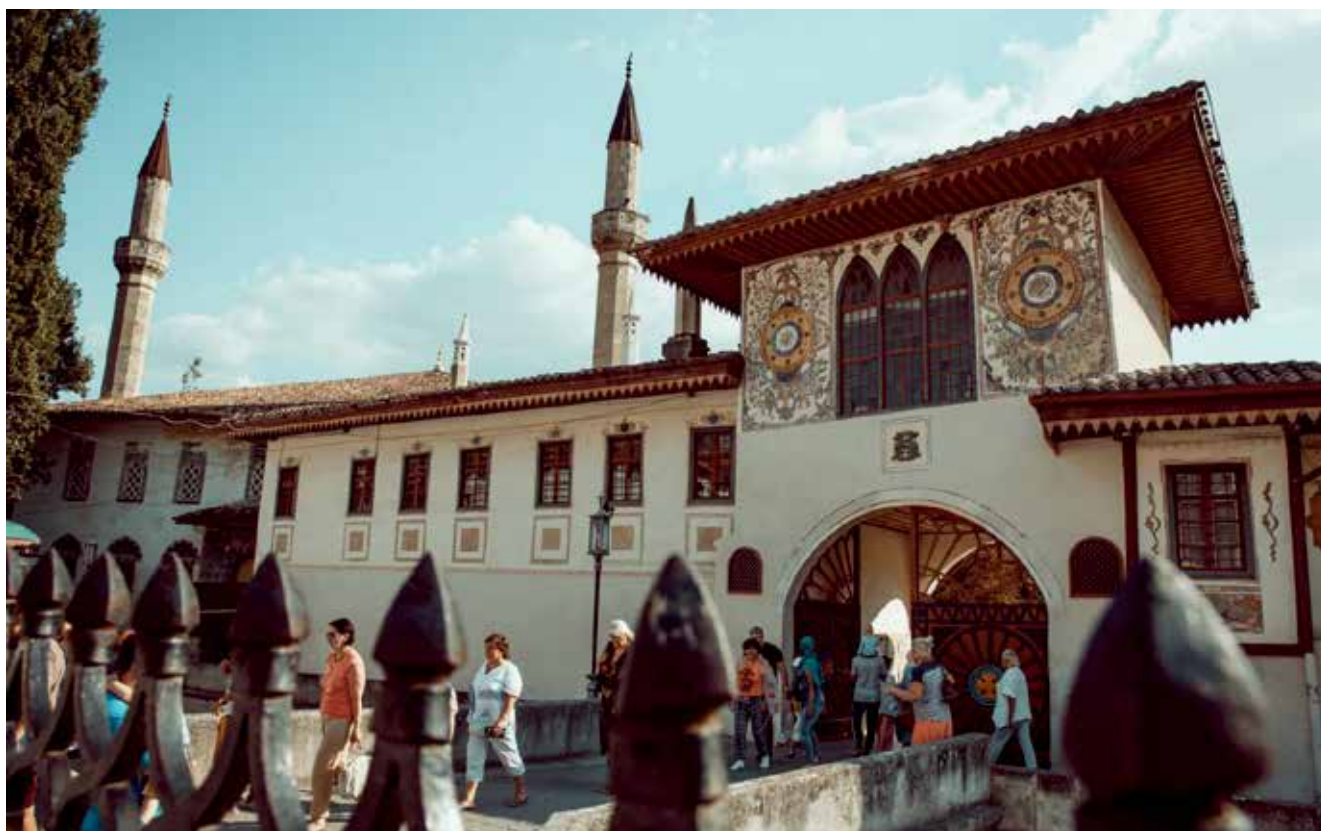
Obrázek 9: Chánský palác v Bachčisaraji.

uzavřel spojení se záporožskými kozáky Bohdana Chmelnického, čímž napomohl ukrajinskému hejtmanství, aby se oddělilo od polsko-litevského knížectví. Během druhé severní války (1655–1660) se však naopak účastnil bojů na straně Polska. V neposlední řadě udržoval čilý kontakt s Osmanskou říší, pod jejíž ochranou se zachováním vysoké míry autonomie se tři sta let nacházel. V roce 1774 získal s výraznou ruskou pomocí na slábnoucí osmanské říši nezávislost, tento akt ovšem paradoxně znamenal začátek jeho konce. Novou „ochranu“ mu totiž nabídlo právě Rusko, které z něj díky diplomatickému a vojenskému umu Kateřiny Veliké a jejího přítele Grigorije Potěmkina velmi brzy učinilo svoji novou kolonii.