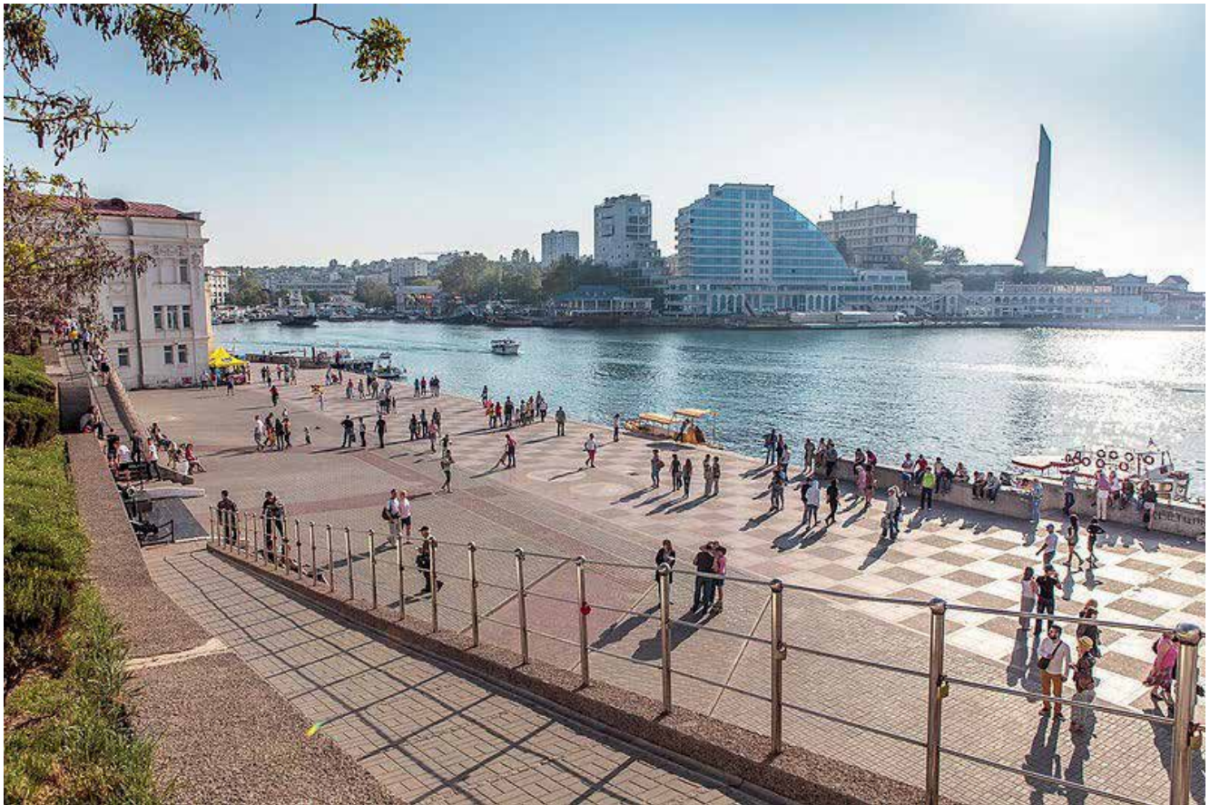
Obrázek 14: Dnešní Sevastopol.