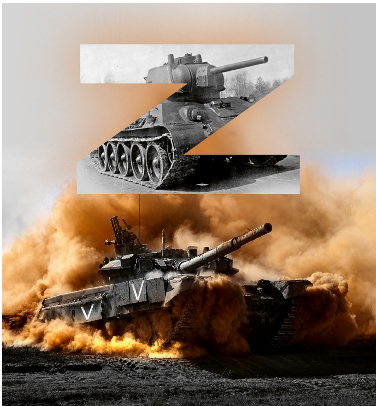
Propaganda ruského ministerstva obrany, plakáty týkající se „speciální vojenské akce“.

dalších událostí ale ukázal, že proruské síly nebyly na Ukrajině momentálně tak mocné, aby ji dokázaly zcela vyšinout z jejího víceméně prozápadního kurzu a vrátit celou Ukrajinu do náruče Moskvy.