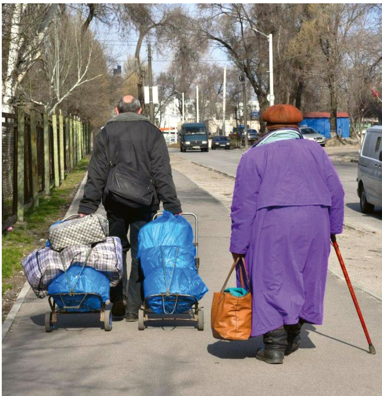
Dva životy na dvou kravčúčkách?