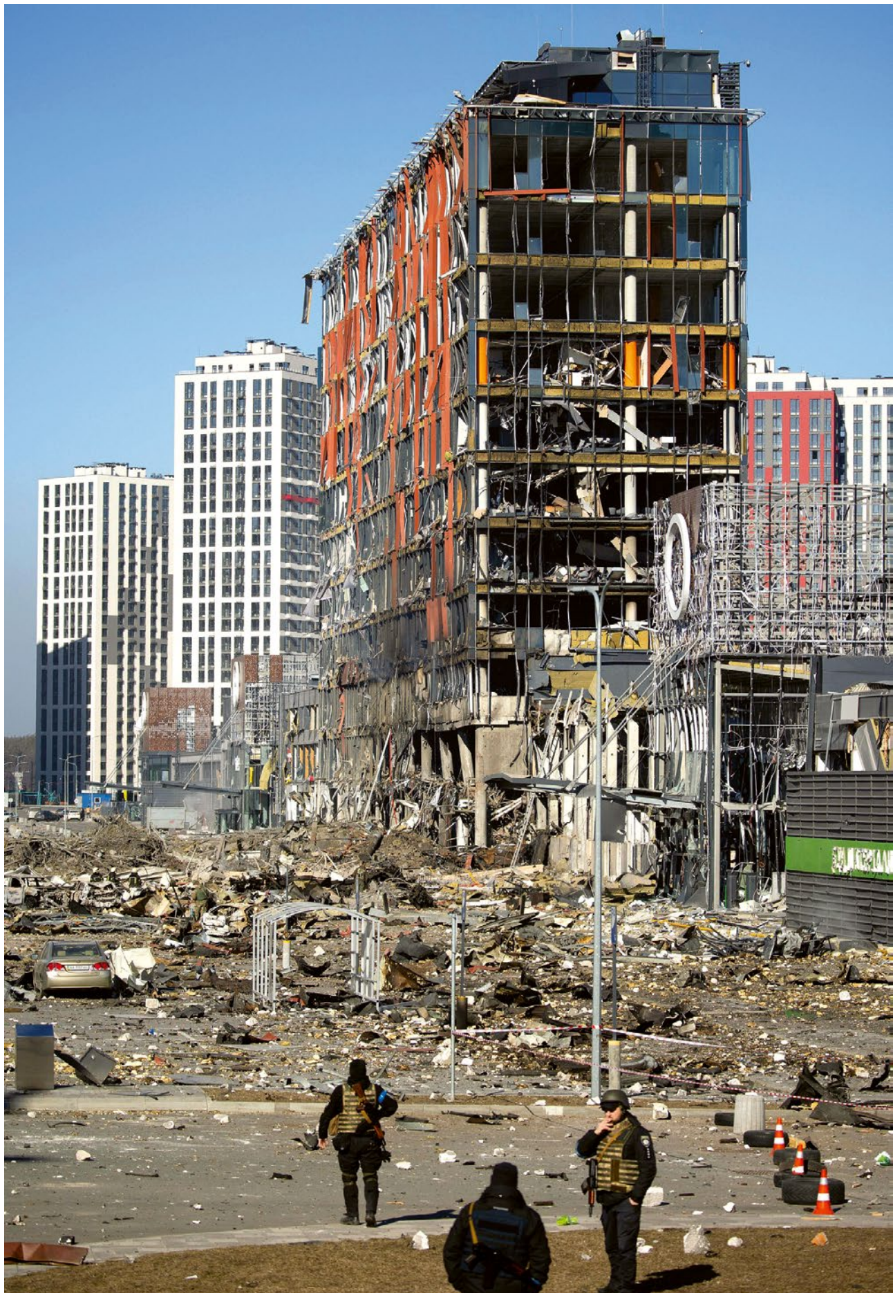
Nákupní středisko Retroville v Kyjevě zničené masivním raketovým útokem, březen 2022.