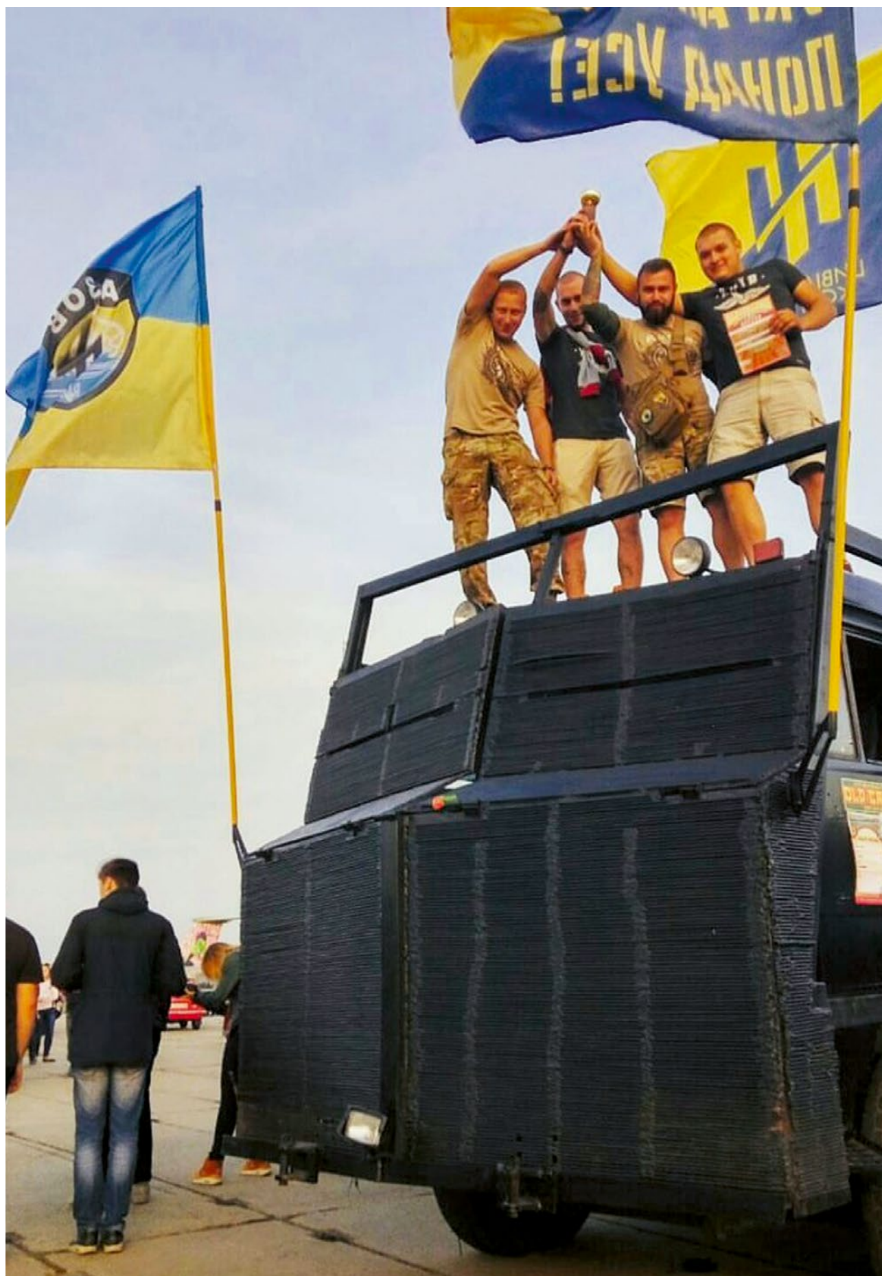
Legendární Prjanyk (Perník), obrněné vozidlo praporu Azov, na kyjevském festivalu starých aut v roce 2016.