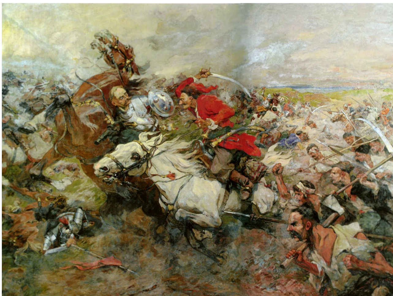
Mykola Samokys: Bitva Maxima Kryvonose s Jeremiášem Wiśniowieckým, Národní umělecké muzeum Ukrajiny, Kyjev.

Názvy Ukrajina, Okrajina v polském království a litevském knížectví, ve 14. a 15. století označovaly pohraniční periferní oblasti. Zatímco většina „Okrajín“ svůj název během času ztratila a ujal se pro ně název jiný, v oblasti kolem řeky Dněpru se toto pojmenování přeneslo na mnohem širší území, než bylo to původní. Od 16. století začíná být název Ukrajina používán souběžně s pojmem Rus a postupně převládal, až se stal oficiálním názvem celé země.