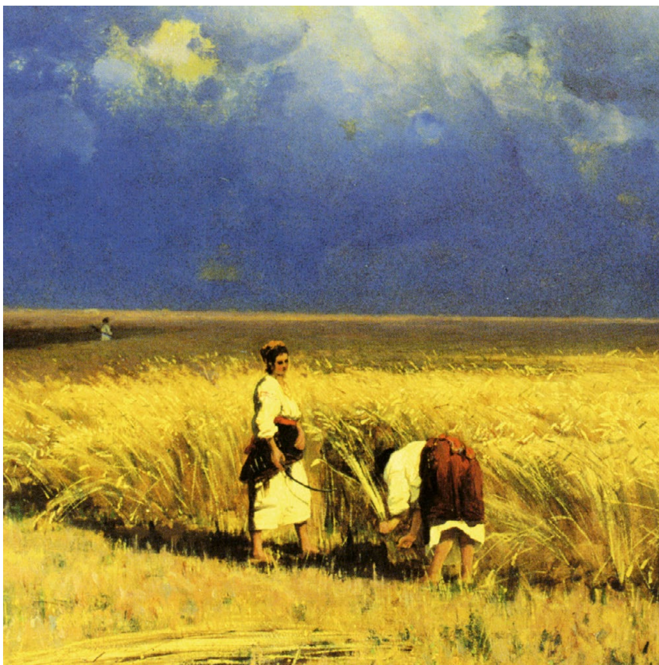
Volodymyr Orlovskyj: Sklizeň, 1882 (detail). Ukrajinská krajina, žluté obilné lány a modrá obloha jsou barvy ukrajinské vlajky. Národní umělecké muzeum Ukrajiny, Kyjev.