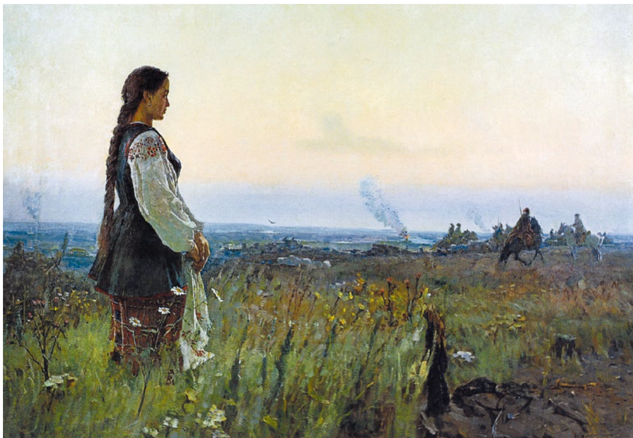
Mychajlo Kryvenko: Kozák odjíždí do boje, Národní umělecké muzeum Ukrajiny, Kyjev.

Po rozbití Petljurovy, Piłsudského a Wrangelovy armády získali bolševici kontrolu nad celým ukrajinským územím, avšak vítězství ještě dosaženo nebylo. V říjnu 1920 vypuklo velké rolnické povstání a proti bolševikům aktivně vystupoval i Nestor Machno, který ještě po nějakou dobu kontroloval celé oblasti na střední a jižní Ukrajině. Definitivně ovládnout Ukrajinu se bolševikům podařilo postupně počátkem dvacátých let.